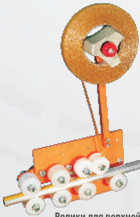
Ролики для верхней трубы