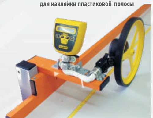
для наклейки пластиковой полосы