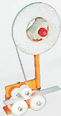
для плоских направляющих